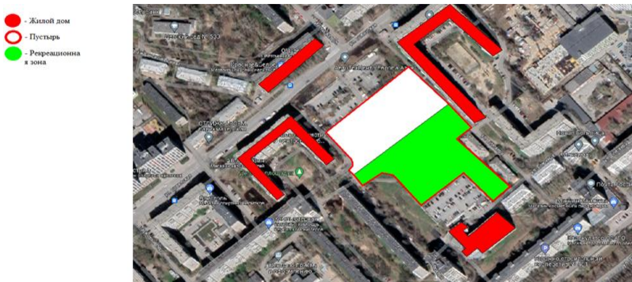
Рис.1. Рекреационная зона Кировского района

Жилая зона не была включена в таблицу, так как она не является основным объектом исследования.