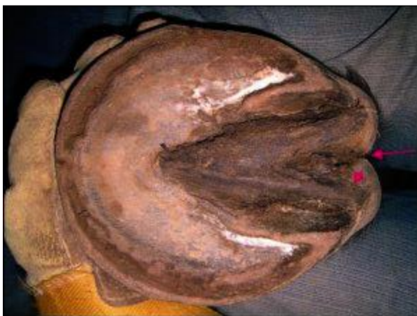
Рис. 2. Область поражения стрелки копыта

При этом растворы для ножных ванн использовали многократно, и дополнялись по мере уменьшения объема раствора в ванночке, чтобы в нее погружалось все копыто и уровень раствора был выше венчика на 5 см.